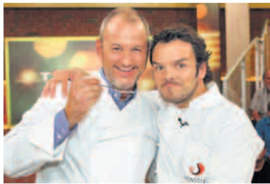
Die Fernsehköche Frank Rosin und Steffen Henssler sind ab Montag täglich im ZDF zu sehen

schlau, schnell und kreativ sein“, erklärte der Mainzer Sender. Am Ende der Sendung entscheidet Juror Frank Rosin, der Zuschauer bereits aus der Kabel-Reality-Kochshow „Das Fast Food-Duell“ bekannt ist, welches Team das beste Gericht auf den Teller gebracht hat.